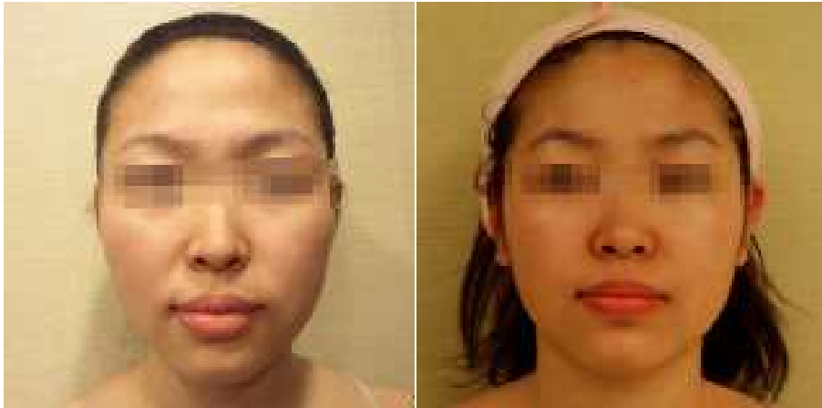
Fig. 2. Before(left) and after(right) the hand massage