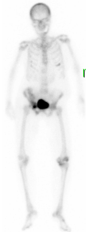
Figure 1. Whole body bone scan after intravenous injection of Tc-99m HDP. Increased uptake in the left knee is suggestive of arthritis. Right ilium and inferior pubic rami also show increased uptake, which is compatible with known multiple pelvic bone fracture.

반코마이신 치료 실패에 영향을 미치는 반복적인 황색포도알균 균혈증 발생의 위험성은 메치실린 내성 황색포도알균이 동정되고 이에 따라 장기간 반코마이신을 투여했던 과거력 및 당뇨와 만성 신부전 등의 기저 질환이 있을 경우에 높아진다[1]. 그 밖에 인공 삽입물이나 혈관 내 장치가 존재하거나 두 개 이상의 다발성 감염 및 전이성 감염일 경우에 반코마이신 치료 실패의 위험성이 높아지는 것으로 알려져 있다[5]. 최근 Yoon 등은 반복적인 메치실린 내성 황색포도알균 균혈증의 발생을 예측할 수 있는 위험 인자로 인공 삽입물 또는 전이성 감염의 존재 유무 및 반코마이신에 대한 MIC가 2 µg/mL 이상인 경우를 보고