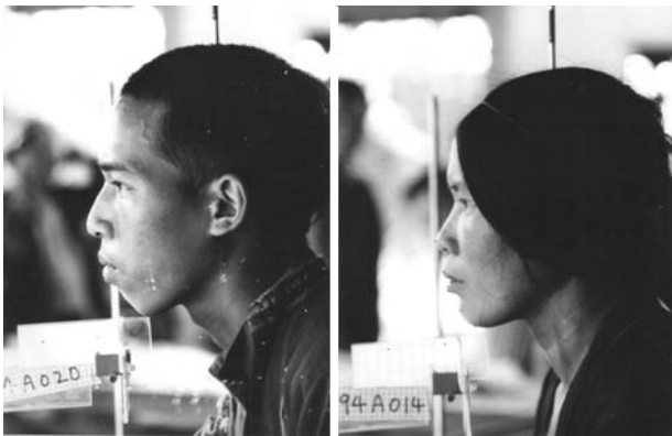
Fig. 1. Lateral facial views of Aka tribe.