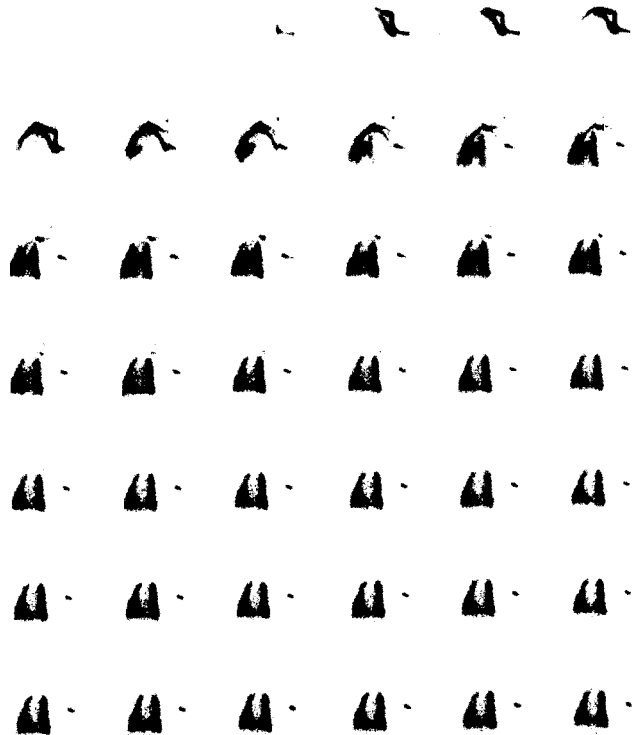
Fig. 2. Postoperative lung perfusion scan of the recipient dog. The even distribution of the both lung perfusion was noted 2 days after operation.