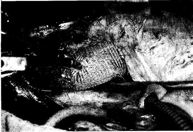
Fig. 3. Aortic root was replaced with tubular Dacron graft and coronary arteries were reimplanted.