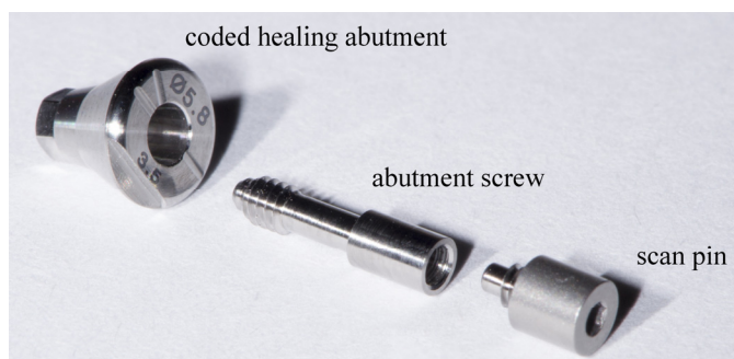
Fig. 1. Structure of the coded healing abutment characterized by connection to the implant fixture via a separate abutment screw. Scan pin may not exist depending on the implant systems.

코딩되어 있다는 의미는 임플란트 식립 깊이, hex 방향, 임플란트 platform 직경 등과 같은 임플란트 식립체에 관한 정보가 내장되어 있다는 것이다. 전통적인 치유 지대주와 달리 코딩된 치유 지대주는 별도로 분리되는 나사(abutment screw)를 매개로 임플란트 식립체와 연결된다는 특징이 있다(Fig. 1).