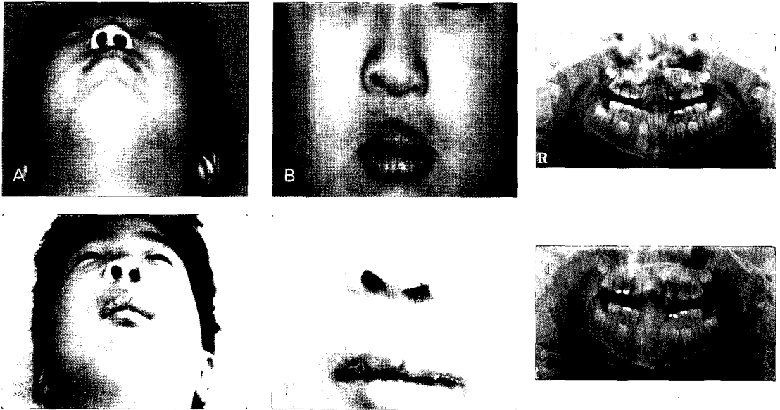
그림 3. Case 2 patient : Eight-year-old boy. A. Oblique SMV view photo, pre-operatively. B. Frontal view photo, pre-operatively. C. Panoramic view, pre-operatively. D. Oblique SMV view photo, post-operatively. E. Frontal view photo, post-operatively. F. Panoramic view, post-operatively.