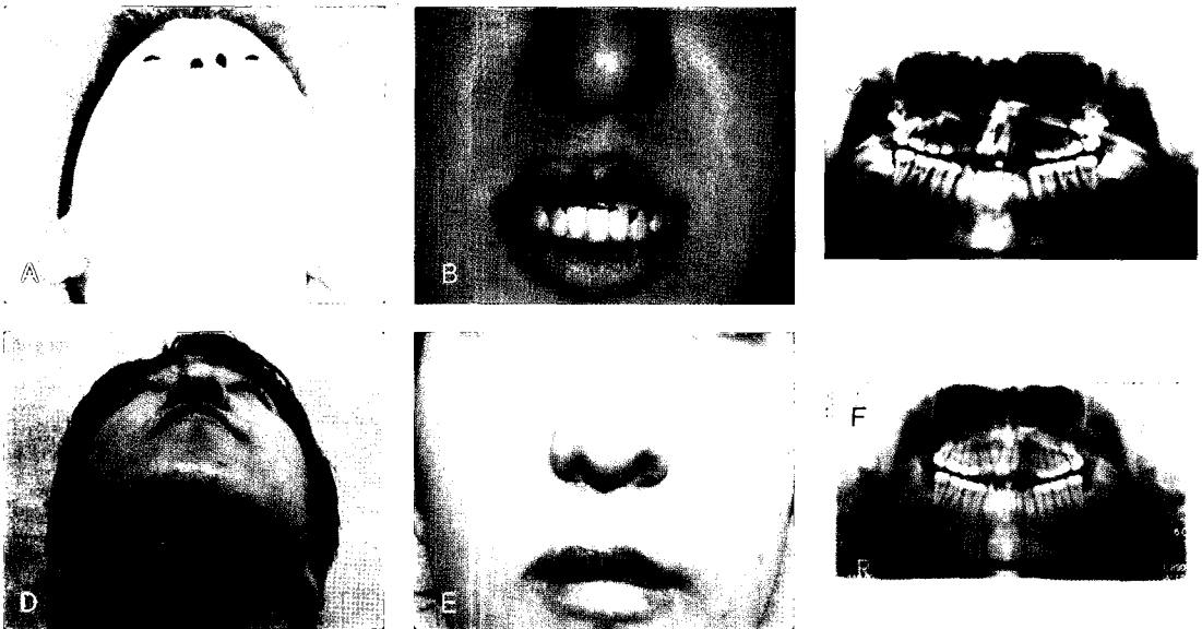
그림 4. Case 3 patient : Twenty-year-old male. A. Oblique SMV view photo, pre-operatively. B. Frontal view photo, pre-operatively. C. Panoramic view, pre-operatively. D. Oblique SMV view photo, post-operatively. E. Frontal view photo, post-operatively. F. Panoramic view, post-operatively.