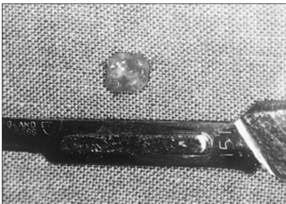
Fig. 2. 채취한 매식체의 모습.

계대배양된 사람 치조골세포가 무흉선 누드 마우스에서 골을 형성할 수 있는지 평가하기 위하여 다음과 같은 과정을 시행하였다. 트립신으로 처리하여 분리된 세포들 ( 6 \times 10^6 cells)을 제 I형 콜라겐 용액 (Nitta Co., Japan)과 혼합하였다. 이 혼합액을 5 \times 5 \times 5 \text{mm}^3 크기의 고형의 소 교원기질 (bovine collagen matrix, B.Braun Melsungen AG, Germany) 속으로 침투시킨 후 37^\circ\text{C} 에서 1일간 배양하여 콜라겐 용액을 겔로 만들었다. 이렇게 형성된 복합체를 8~12주 된 암컷 무흉선 누드 마우스의 피하조직에 매식하였다. 매식방법은 문헌에 기술된 방법을 따랐다 8) . 매식시 0.01ml/g 용량의 4% chloral hydrate를 마우스의 복강내로 주사하여 마취시킨 후 마우스의 등쪽에 약 1cm 길이의 피부절개를 형성하고 피부를