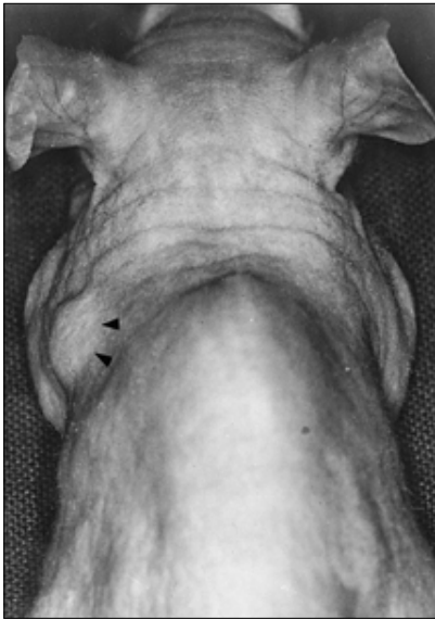
Fig. 1. 매식체를 이식한 후 무흉선 누드 마우스의 모습. (▲:매식체 부위)