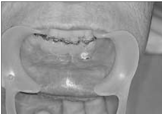
Fig. 7. Postoperative feature : The intermaxillary fixation is showed with incision & drainage on the oral fistula and endodontic drainage teeth (# 32, 33).