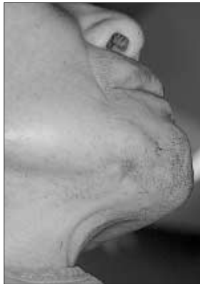
Fig. 4. The final submental wound:Good healed wound is showed without the exudate discharge.