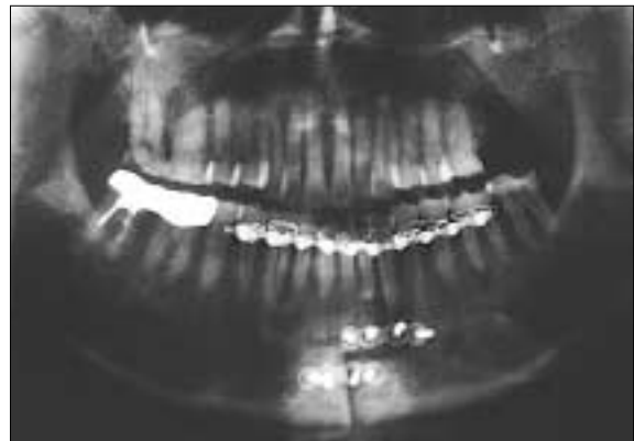
Fig. 8. Panoramic view at about 10 weeks after the intermaxillary fixation: The clinical bony union is attained with the remained plate & screws.