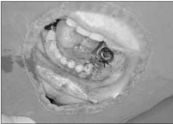
Fig. 9. The first oral examination : The more inflammatory reaction is showed around the teeth(#33,34) of the paramedian mandibulotomy.

그 후 악간고정 시행 73일째에 골절편의 완전유합을 확인하고서 arch bar를 제거했고, 이어서 골절선 상부 치아(#32, 33)의 근관치료를 약 3주일간 시행해 양호한 치유를 확인했다(Fig. 8).