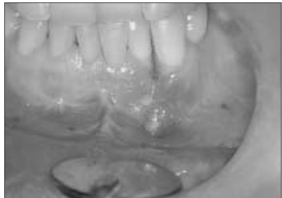
Fig. 6. The first oral examination : Nonunion & fistula are showed between the tooth (#32) and the tooth(#33).