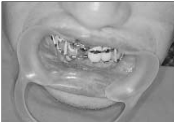
Fig. 3. Postoperative feature:Intermaxillary fixation is showed with incision & drainage on the oral fistula and endodontic drainage of the tooth (#42) on the line of mandibular fracture.