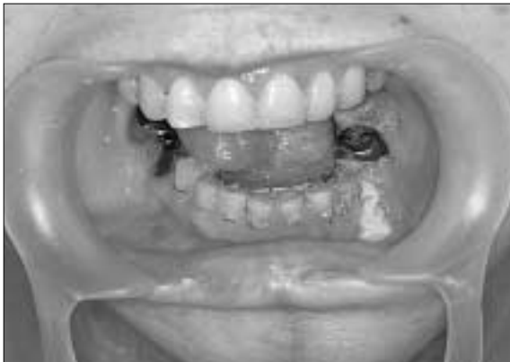
Fig. 11. Postoperative feature: Arch bars are applied onto the lingual & buccal aspects of the mandibular teeth with the drainage via extraction wound of the tooth(#34).