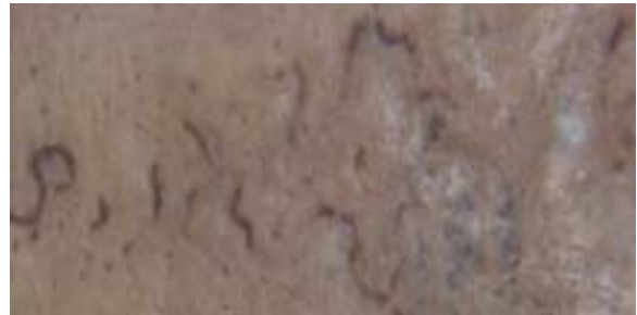
Stage 3 : Suture is closed in a wide area.