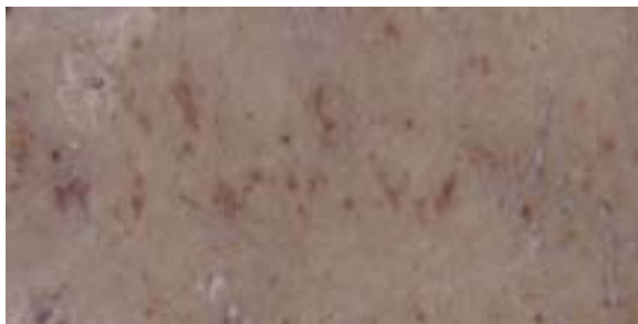
Stage 4 : Suture is completely obliterated or only pits indicate where the suture is located.