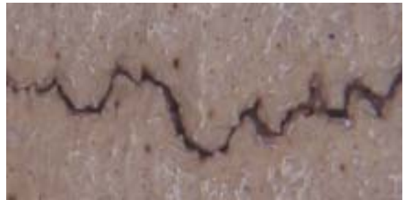
Stage 1 : Suture is closed, but visible through the loupe.