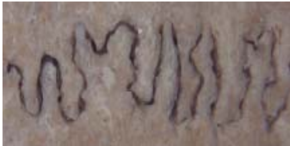
Stage 2 : Suture is closed as a small point and visible with the naked eyes.