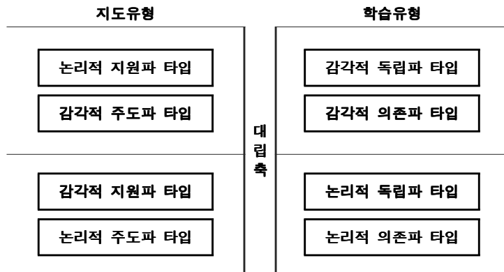
<그림3> 지도유형과 학습유형과의 관계

그림을 참조하여 보면, 두가지 척도와 네가지 특성을 살펴볼 수 있는데, 논지파(논리적 지원파 타입), 감지파(감각적 지원파 타입), 논주파(논리적 주도파 타입), 감주파(감각적 주도파 타입)등으로 나눌 수 있다.