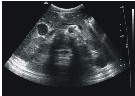
Fig. 2. Abdominal ultrasonography shows normal liver, GB, spleen, pancreas, kidney and urinary bladder.