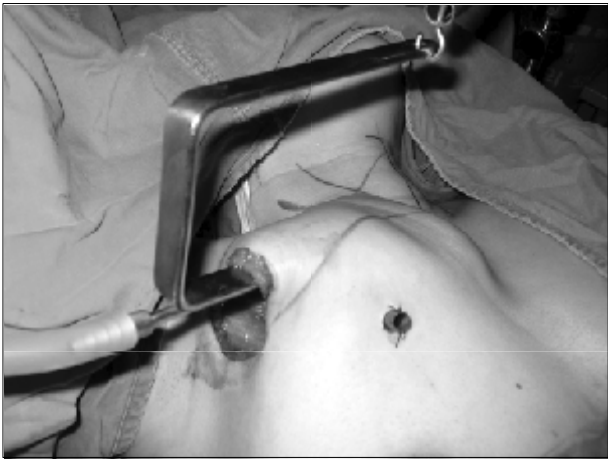
Fig. 1. Gasless endoscopic thyroidectomy via an axillary approach. A 3.5 cm vertical skin incision was made in the axilla. To create a working space, an external retractor was inserted through the incision and was raised using a lifting device. Another 0.5 cm skin incision was made near the 3.5 cm skin incision.

외과학교실(n=111)과 한림대학교 의과대학 강동성심병원 외과(n=30)에서 액와접근법을 이용한 무기하 내시경적 갑상선절제술을 시행한 141명의 환자를 대상으로 의무 기록 및 설문 조사 결과를 재검토하여 후향적 연구를 시행하였다. 평균 연령은 34.7±10.8세(6~59세)였으며, 갑상선 결절에 대한 수술 전 진단은 고해상도 초음파 유도하 세침 흡인 생검을 통해 이루어졌다.