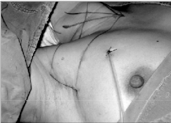
Fig. 4. A 3 mm closed suction drain was placed at the site of the 0.5 cm skin incision. The wound was closed cosmetically. The small incision scar in the axilla was completely covered when the arm was in the natural position.

증을 통해 평가하였다. 수술 후 각각 2개월, 4개월에 환자를 대상으로 설문 조사를 시행하여 경부 및 전흉벽부의 감각 감퇴 혹은 이상 감각 여부(예/아니오), 연하 시 불편감 여부(예/아니오) 및 미용적 만족도(매우 만족/만족/ 불만족/ 매우 불만족)를 조사하였다.