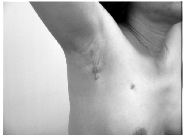
Fig. 5. A photo of a 43-year-old woman 8 months after gasless endoscopic thyroidectomy via an axillary approach.

대상 환자 모두는 수술 후 미용적 결과에 '만족'하였고, 이 중 111명(70.7%)의 환자가 '매우 만족'한 것으로 조사되었다(Fig. 5).