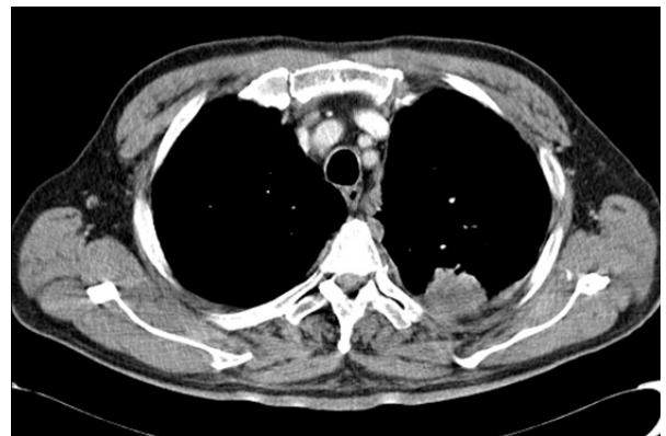
Figure 2. Chest CT scan reveals pleural nodularity and an irregular-shaped subpleural mass in the left upper lobe.

병리 소견: 입원 시 시행한 흉막 생검 및 흉수 세포검사에서는 악성 세포가 관찰되지 않았다. 이후 폐암의 확진