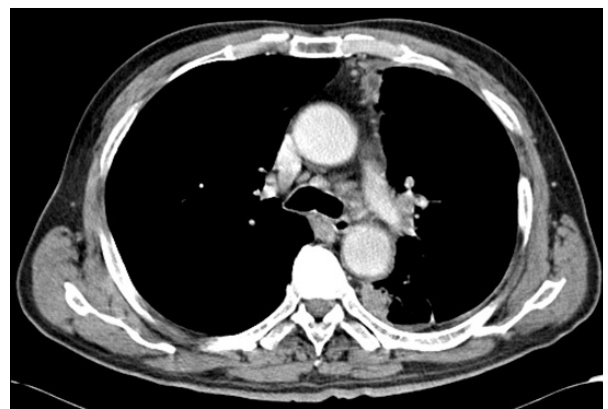
Figure 3. Chest CT scan shows multiple enlarged lymph nodes in the left hilum and both paratracheal areas.