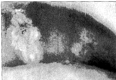
Fig. 1. Two aphthous ulcers in the posterior palatal area.

일반적으로 재발성 구강 궤양은 베체트병 환자에서 공통적으로 발견되며, 많은 경우(47-86%) 구강 궤양은 다른 증상이 나타나기 수년 전에 선행하여 베체트병의 첫 번째 증상으로 나타난다 13,14) . 만 16세 전에 베체트병으로 진단받은 17명의 어린이를 대상으로 한 Borlu 등 15) 의 연구에 따르면 구강 궤양은 모든 어린이에서 베체트병의 첫 번째 임상 증상으로 나타났다. 이와 비슷하게 만 15세 이전에 베체트병이 발병한 40명의 한국 어린이를 대상으로 연구한 Kim 등 9) 은 모든 어린이에서 구강 궤양 소견이 나타났으며, 이 중 80%에서 구강 궤양은 베체트병의 첫 번째 증상으로 나타났다고 하였다. 이와 같이 높은 빈도로