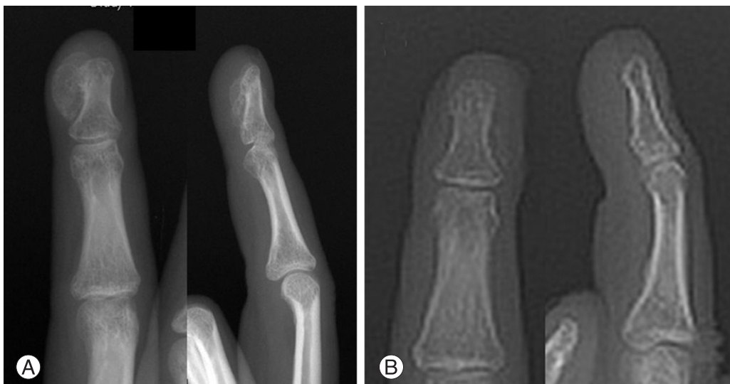
Fig. 4. (Case 4) 17-years-old female with exostosis of right 3rd distal phalanx. Preoperative plain radiograph shows 0.5×0.8 cm sized and 0.5×0.5 cm sized bone density lesions. (A) Preoperative plain radiographs show huge ulnar side mass of 3rd distal phalanx. (B) Plain radiographs of 3 months after the excision and curettage.

상피성 낭종의 진단을 받은 33세 여환의 술 전 및 술 후 단순 방사선 결과 및 컴퓨터 단층 촬영 검사의 결과 및 술 장 종괴 소견과(Fig. 1), 사구체종 진단의 26세 남환의 술 전 및 술 후 단순 방사선 결과 및 자기공명영상 검사 결과는 그림과 같다(Fig. 2). 상기 상피성 낭종의 예는 약 3년의 우측 제3수지 원위지 척측 부위의 통증 및 축진되는 종괴 및 조갑의 변형을 주소로 내원하여 종괴 전 절제술 및 골소파술을 시행 받았다. 26세 사구체종 남환의 경우는 약 1년간의 조갑 근위부의 압통과 근위 조갑의 불규칙 변형을 주소로 내원하여 종괴 전 절제술을 받았다.