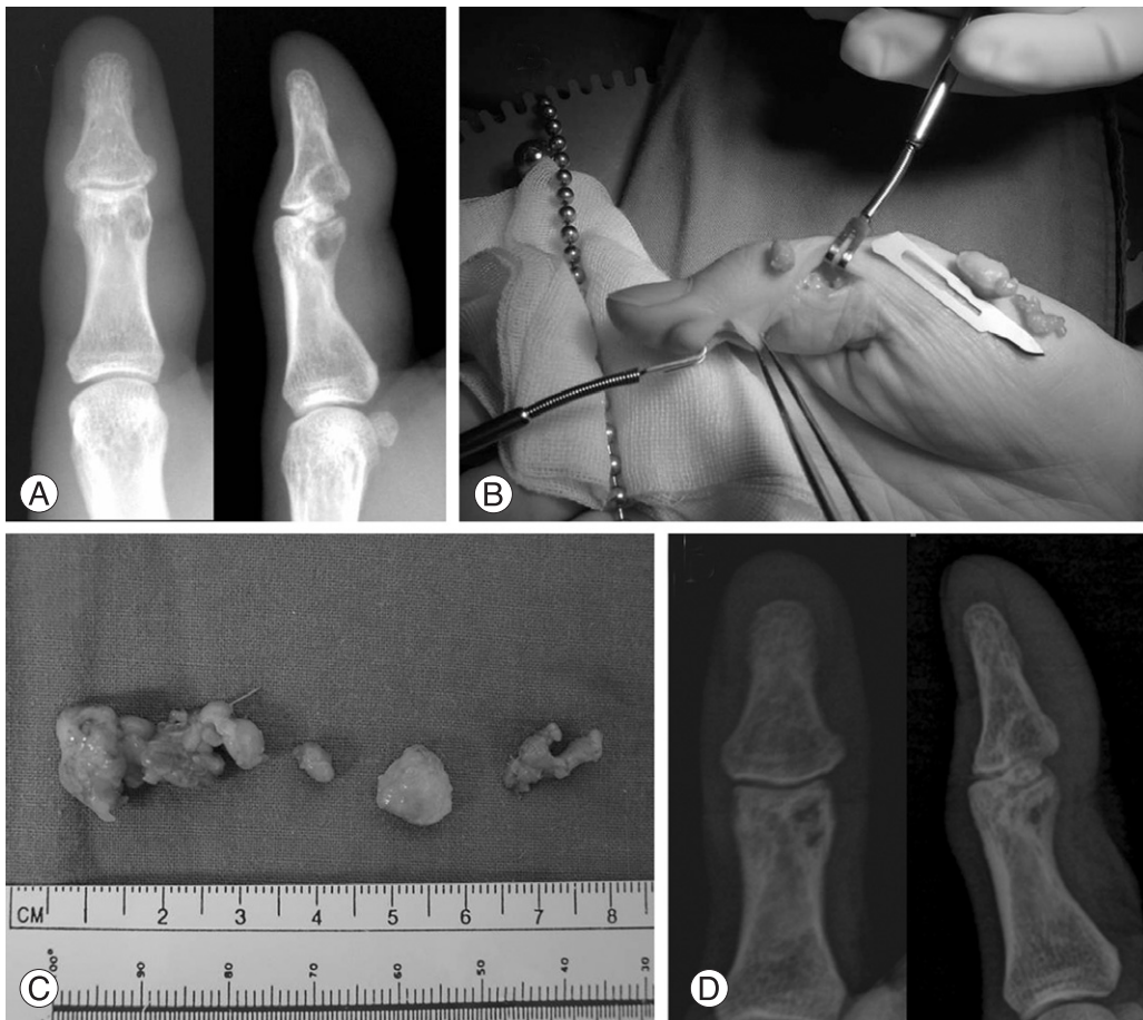
Fig. 3. (Case 3) 41-years-old female with giant cell tumor of tendon sheath at distal-to-proximal phalanx of right thumb. (A) Preoperative plain radiographs show bony erosions at distal and middle phalangeal bones, simultaneously. (B) Tumor removal was performed through volar, radial and ulnar incisions, since it was too large to remove from one incision. (C) The mass was removed grossly in four pieces. (D) Plain radiographs of 24 months after the marginal excision and curettage.