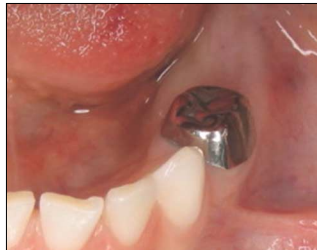
Fig. 1. Initial clinical view

하악 좌측 제2소구치 치배는 하악 우측 제2소구치 치배에 비하여 발육단계가 더 늦은 것을 관찰할 수 있었다(Fig. 3, 4). 이상의 소견으로 치아종에 의하여 하악 좌측 제2유구치가 매복되고 원심경사되었으며, 치료하지 않을 경우 하악 좌측 제1대구치도 매복될 것으로 판단되어, 하악 좌측 제1대구치와 제2유구치 상방에 존재하는 치아종을 외과적으로 제거하고 원심경사되어 매복된 하악 좌측 제2유구치의 교정적 견인을 시행하기로 하였다.