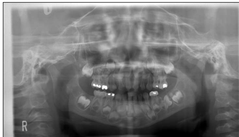
Fig. 3. Panoramic view (Initial)