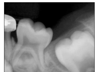
Fig. 12. After 12 months.