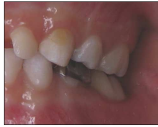
Fig. 14. Final clinical view.