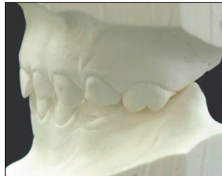
Fig. 2. Initial study model.