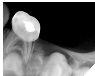
Fig. 7. Initial periapical view