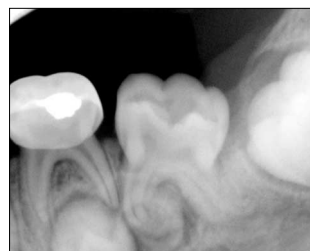
Fig. 11. After 9 months.