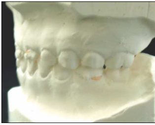
Fig. 13. Final study model.