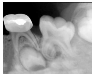
Fig. 9. After 5 months.