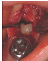
Fig. 5. After odontoma removal

정기적인 임상 및 방사선 검사 소견상, 하악 좌측 제2유구치의 원심경사는 점차 개선되었고, 하악 좌측 제1유구치와 비교하여 거의 비슷한 교합면까지 맹출됨이 관찰되었다(Fig. 9, 10). 또한, 하악 좌측 제2유구치와 제1유구치의 인접면 간격이 감소되었으며(Fig. 11), 치료 후 12개월에는 정상에 가까운 치축을 보이고(Fig. 12), 대합치와 정상적으로 교합되었다(Fig. 13, 14).