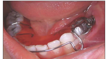
Fig. 6. Removable appliance using orthodontic traction