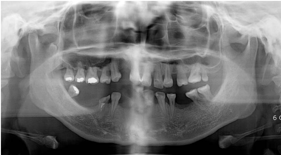
Fig. 1. Panoramic Radiography shows the impacted third molar in right coronoid process.

정신지체 장애 외에 특별한 과거력은 없었다. 어린 나이부터 정기적으로 연세대학교 장애인 클리닉에서 치아우식증 치료 및 발치를 치료받던 중 전체적인 검진을 위해 촬영한 파노라마방사선사진에서 전반적인 치조골 흡수가 관찰되었으며, 다수의 무치악 부위가 관찰되었다. 다수의 무치악 부위는 선천성이 아니라 치아우식증으로 인해 여러 번 치료를 받던 중 우식이 진행되어 발치된 것으로 확인되었다. 특징적으로 우측 오뎀돌기 부위에 과잉치가 매복되어 있는 것이 우연히 관찰되었다(Fig. 1). 환자의 과거력상 제3대구치의 발치 경력은 없었으며 매복된 치아의 주위에 낭성 병소는 관찰되지 않았다. 하악 우측 구치부위에 1개의 대구치가 존재하였는데 정확한 기록이 없어서 확인할 수 없었지만, 치아의 맹출 방향, 치아의 위치 등을 고려할 때 하악 제3대구치가 잔존되어 있는 것으로 판단하였다.