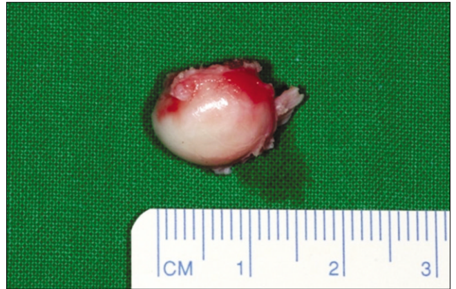
Fig. 3. The excised tumor was 10 mm in length and 13 mm in width, with a whitish smooth surface.