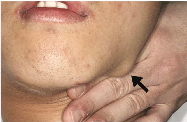
Fig. 1. Osseous protuberance on the left mandibular inferior border. (arrow)