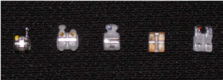
Fig. 1. Tested brackets(from the left side): Metal, MSC1, MSC2, Ceramic1, Ceramic2.

두 종류의 metal slot이 삽입된 polycrystalline ceramic bracket과 두 종류의 monocrystalline bracket, 한 종류의 metal bracket이 사용되었다(Fig. 1). Metal slot이 삽입된 bracket으로 Clarity™(3M Unitek, California, U.S.A.)와 Virage™(American Orthodontics, Wisconsin, U.S.A.)를 사용하였고, monocrystalline ceramic bracket으로 Inspire Ice™(Ormco, Glendora, California, U.S.A.)와 Miso™(HT, Seoul, Korea)를, metal bracket으로 Kosaka™(Tomy, Tokyo, Japan)를 사용하였다. 각각의 bracket은 .022x.028 slot의 상악 소구치용 bracket을 사용하였다. Wire로는 활주 역학에서 견인시 사용되는 .019x.025 stainless steel wire(Ormco, Glendora, California, U.S.A.)를 이용하였다. 결찰재로는 고무링(Ormco, Glendora, California, U.S.A.)을 사용하였다.